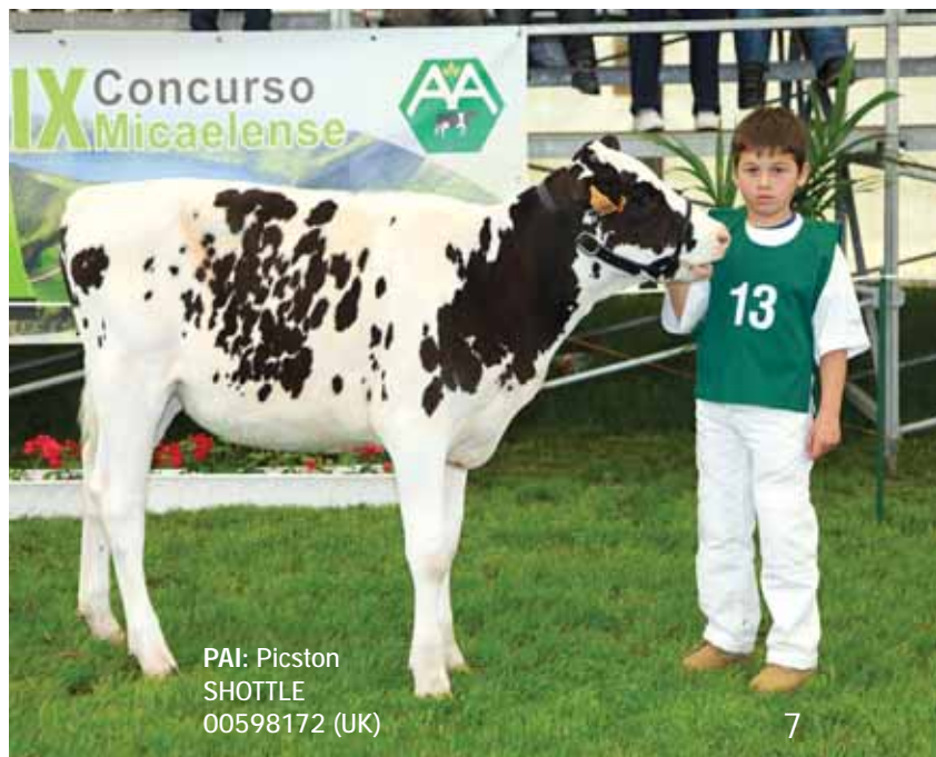
PAI: Picston SHOTTLE 00598172 (UK)