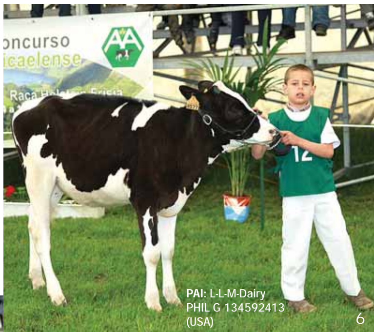
PAI: L-L-M-Dairy PHIL G 134592413 (USA)