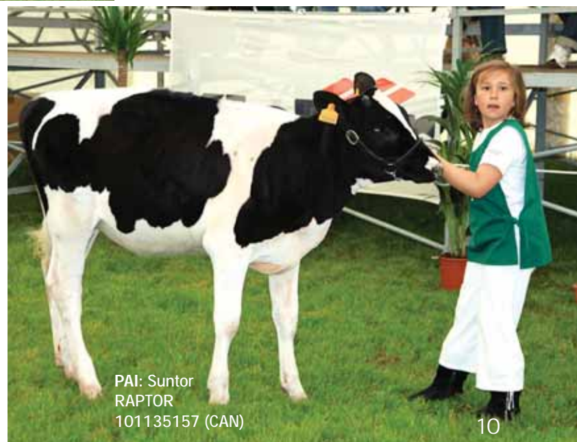
PAI: Suntor RAPTOR 101135157 (CAN)