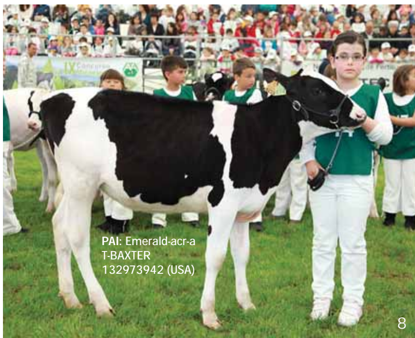
PAI: Emerald-acr-a T-BAXTER 132973942 (USA)