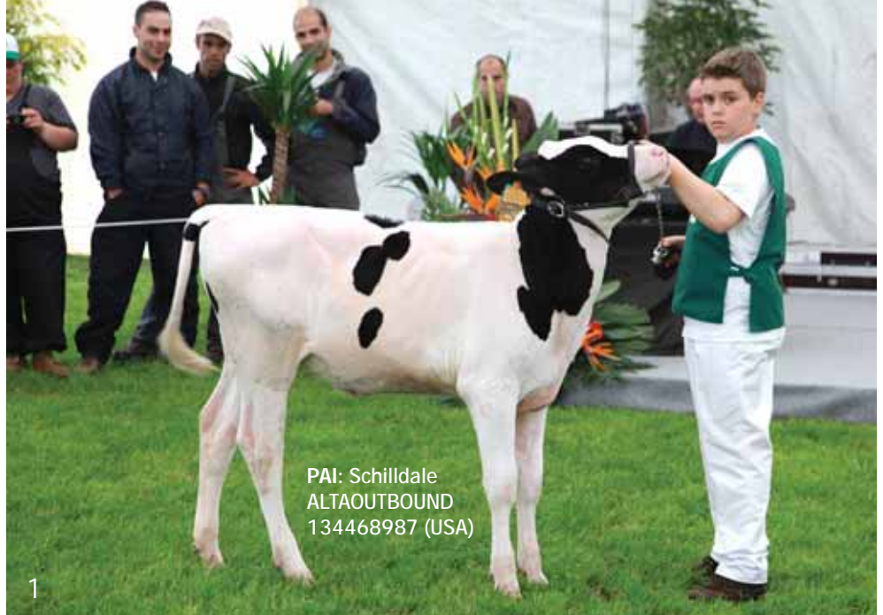
PAI: Schilldale ALTAOUTBOUND 134468987 (USA)