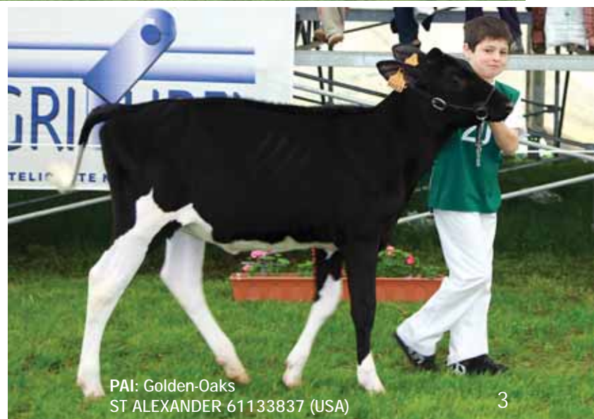
PAI: Golden-Oaks ST ALEXANDER 61133837 (USA)