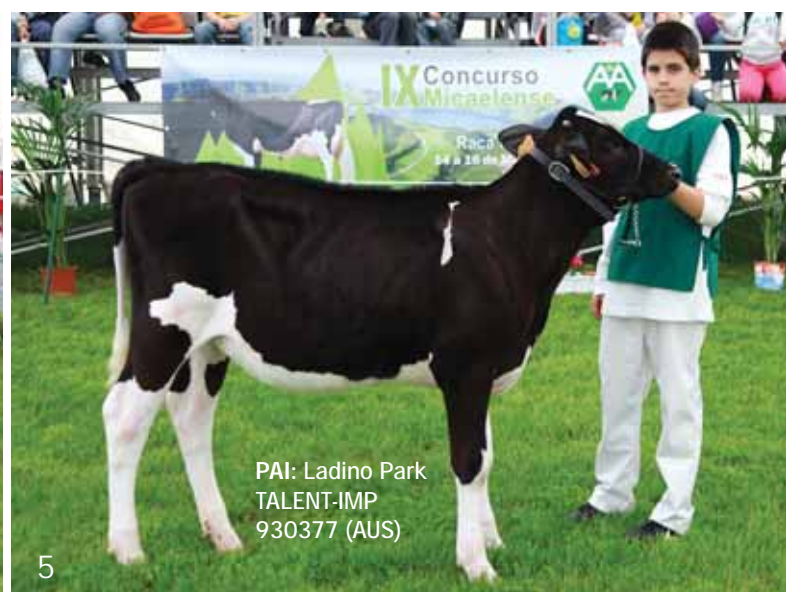
PAI: Ladino Park TALENT-IMP 930377 (AUS)