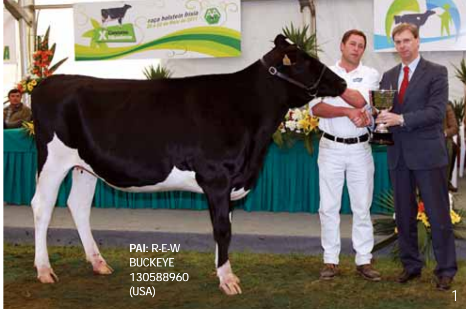
PAI: R-E-W BUCKEYE 130588960 (USA)