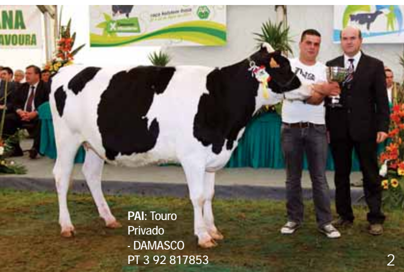
PAI: Touro Privado - DAMASCO PT 3 92 817853