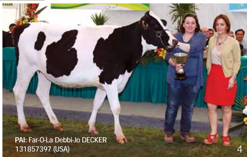
PAI: Far-O-La Debbi-Jo DECKER 131857397 (USA)