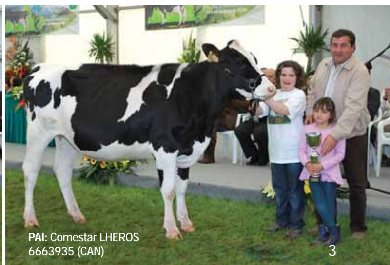
PAI: Comestar LHEROS 6663935 (CAN)