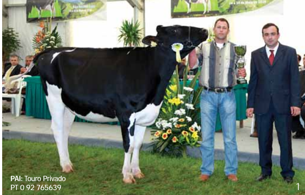
PAI: Touro Privado PT 0 92 765639