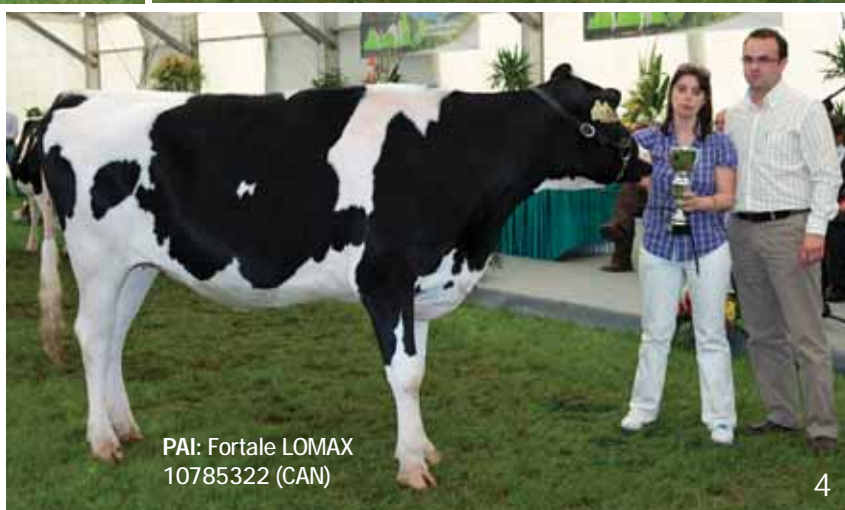
PAI: Fortale LOMAX 10785322 (CAN)

Patrocinador: Varziagro - Máquinas Agrícolas, Lda - Alfaias Agrícolas KRONE e POTTINGER