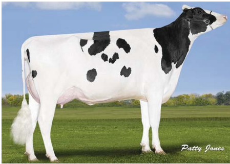
MAPEL WOOD CGAIN MILEY P (Filha)

>> Vacas mais Saudáveis, Elevada Produção de Leite, Beta-Caseína A2A2, Animais para Concursos.