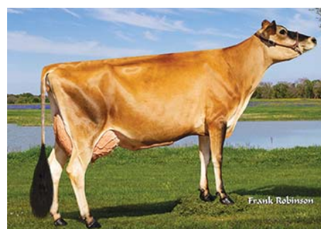
PAULO-BRO CHROME CHICK 2090 (Filha)