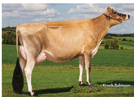
PAULLYN CHROME PROMISE (Filha)