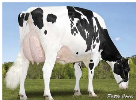
WALNUTLAWN BREANNA VG-88 (Avó)