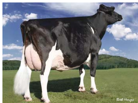
REGANCREST-PR BARBIE EX-92 (Bisavó)