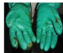
Imagem de luvas verdes usadas na avaliação da ordenha.

A avaliação da máquina e da rotina de ordenha é um ponto muito importante, pois vai detetar onde ocorre a TRANSMISSÃO das mamites.