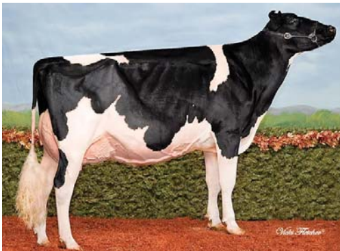
ROCKYMOUNTAIN GOLD WINTER-EX-94