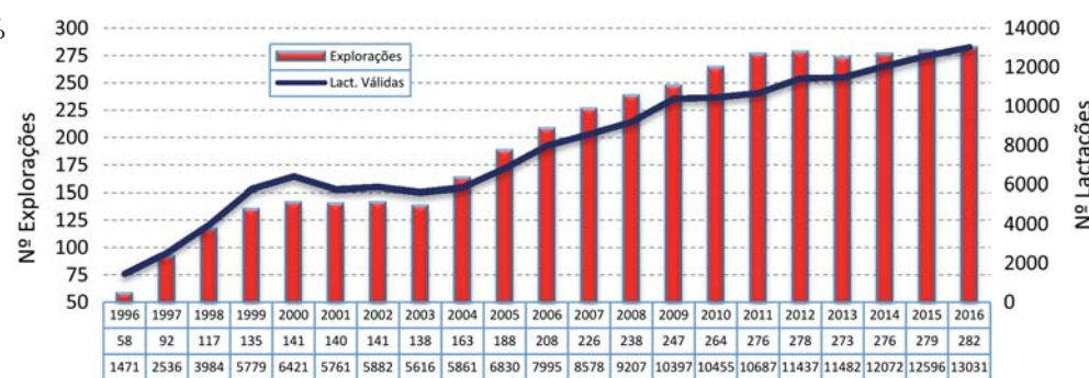
Gráfico 2 Evolução anual do número total de explorações e de lactações válidas em contraste leiteiro.

eles: a genética, a alimentação, o manejo, as infra-estruturas, a formação, o apoio técnico e os investimentos efetuados por parte dos agricultores, que permitiram atingir estes resultados produtivos que estão ao nível das melhores