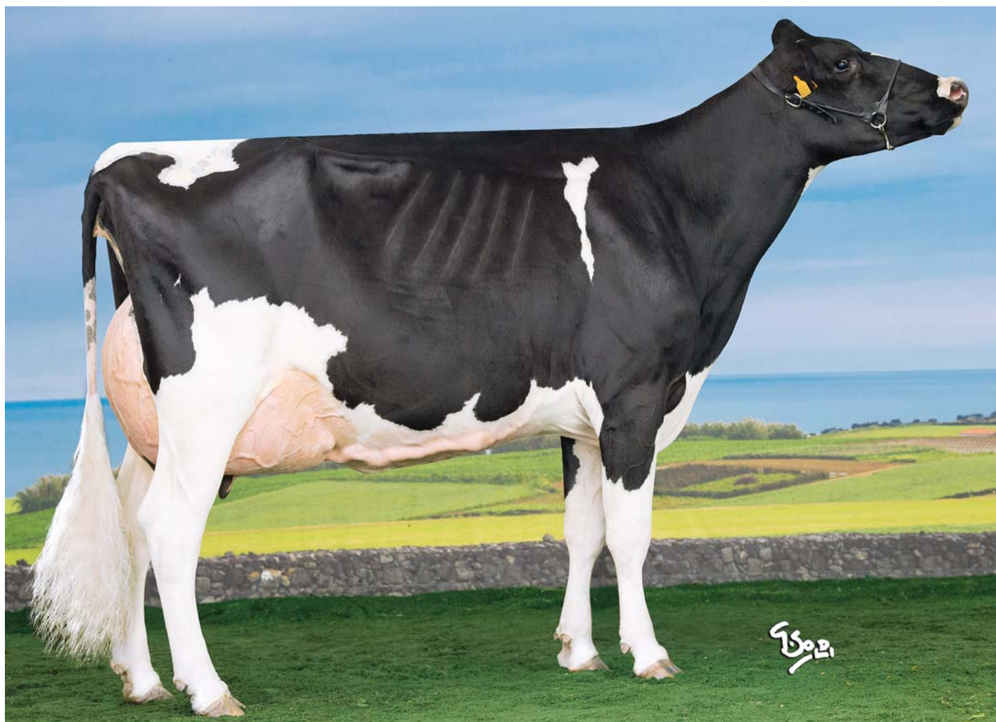
Gráfico nº 1

Evolução da produção de leite aos 305 dias entre 2012 e 2017