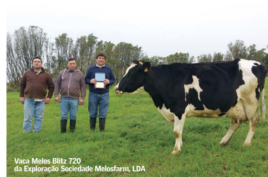
Vaca Melos Blitz 720 da Exploração Sociedade Melosfarm, LDA

b.) A vaca 720 da Sociedade Melosfarm, Lda é o animal que detém o recorde de produção média diária, com 43,7 kg de leite. Esta BLITZ de 89 pontos é uma extraordinária produtora, inclusive já conseguiu arrecadar diversos ▶