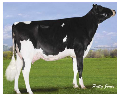
MS LOOKOUT PESK BKM BRIA (Bisavó)